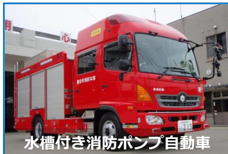
水槽付き消防ポンプ自動車