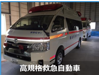
高規格救急自動車

更新基準 ：経過年数 15 年または走行距離 20 万 km 以上（今回は、すべて 15 年が経過したための更新）