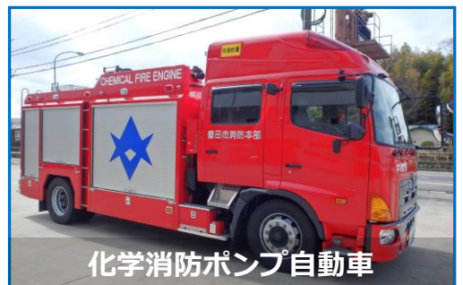
化学消防ポンプ自動車