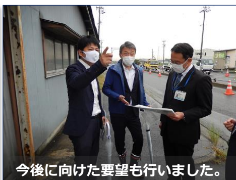
今後に向けた要望も行いました。