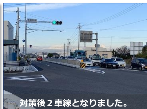
対策後2車線となりました。