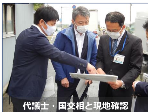
代議士・国交相と現地確認