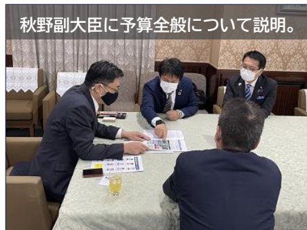
秋野副大臣に予算全般について説明。