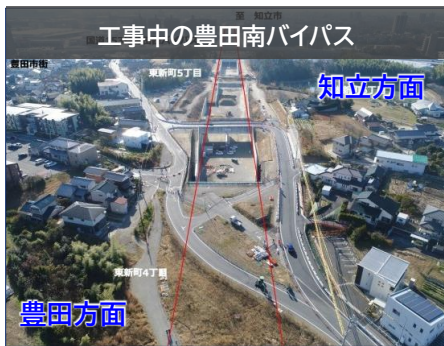
工事中の豊田南バイパス

また、企業が直面している「CNに係る支援拡充」についても LCA ※3 に繋がる要望 をおこなました。