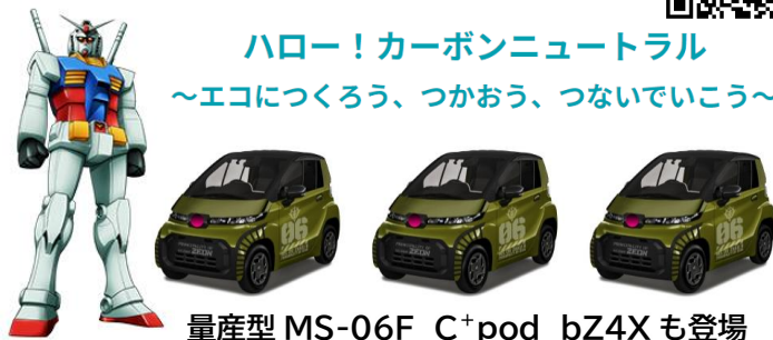
量産型 MS-06F C+pod bZ4X も登場