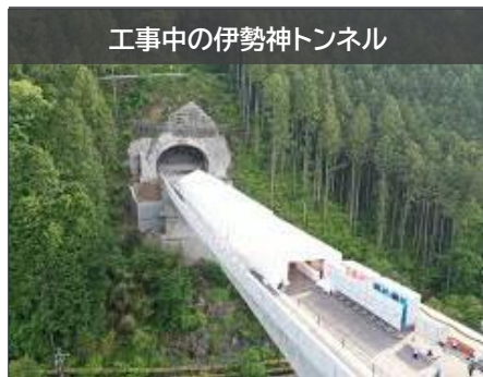
工事中の伊勢神トンネル