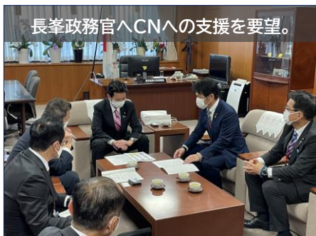
長峯政務官へCNへの支援を要望。