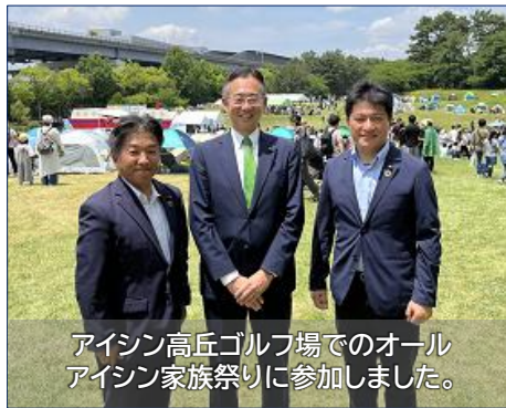
アイシン高丘ゴルフ場でのオールアイシン家族祭りに参加しました。