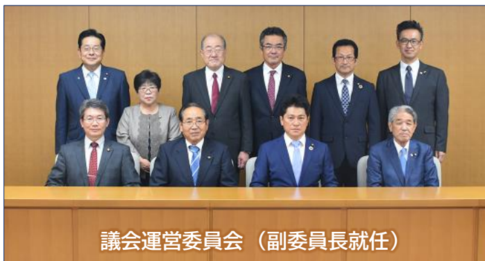
議会運営委員会 (副委員長就任)