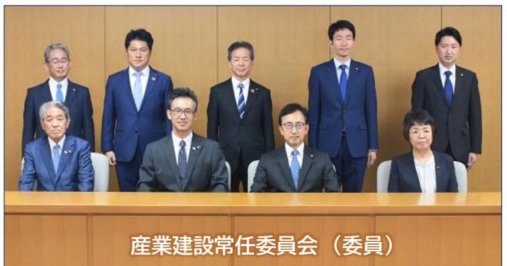
産業建設常任委員会 (委員)