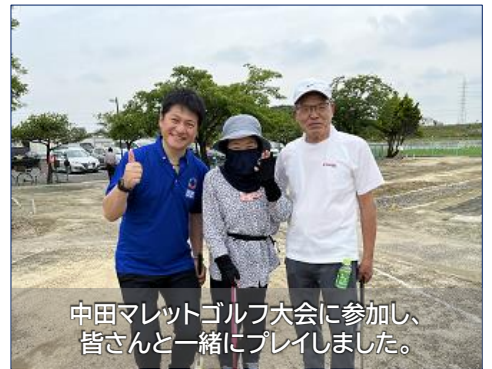
中田マレットゴルフ大会に参加し、皆さんと一緒にプレイしました。