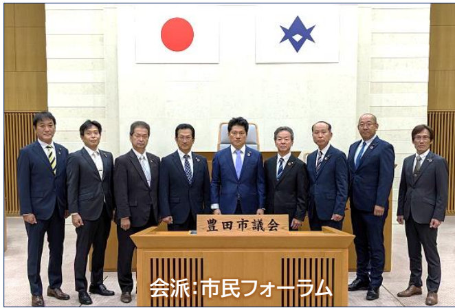
会派:市民フォーラム